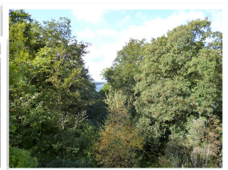
Utsikt från Klinta mot Valjeviken. Före lövsprickningen når blicken längre och mer