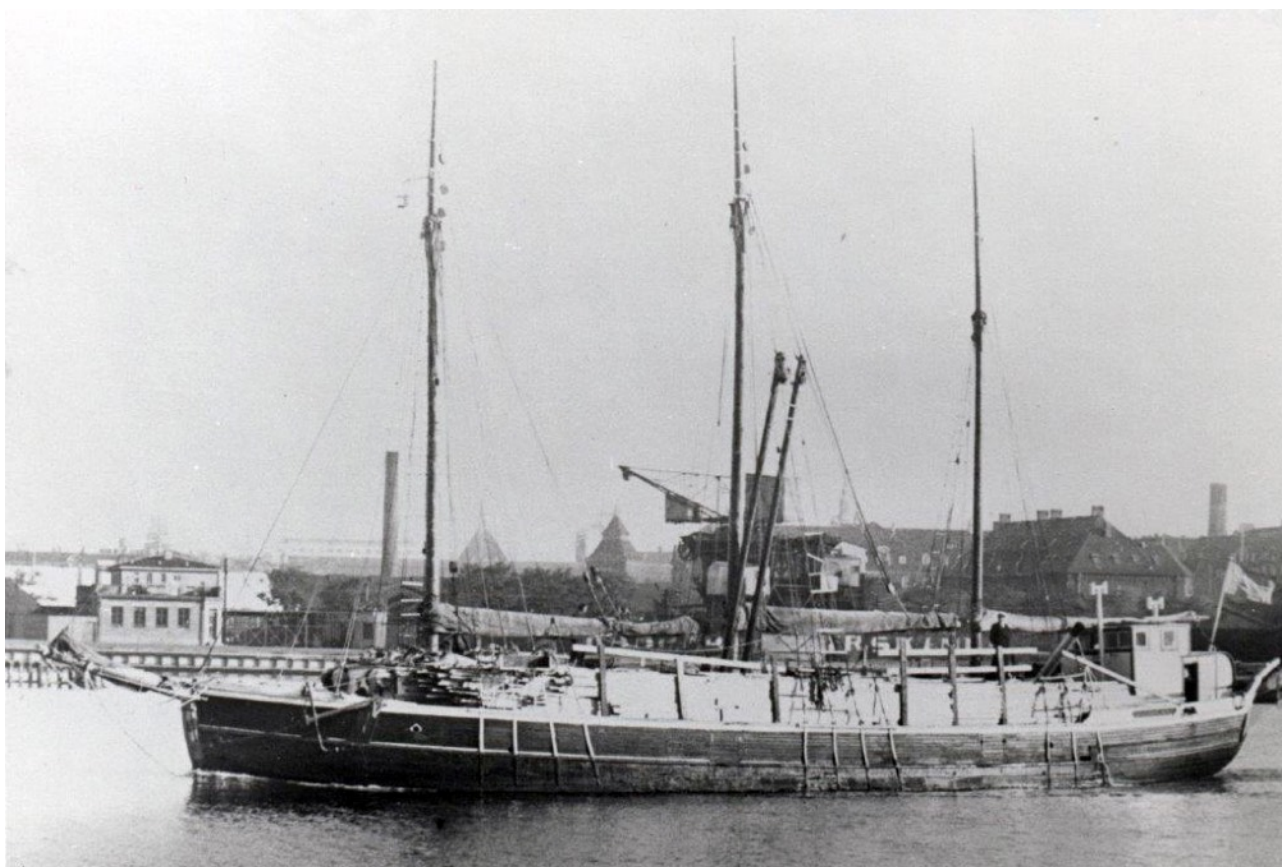
Elisabeth som motorseglare med trälast, 1950-tal