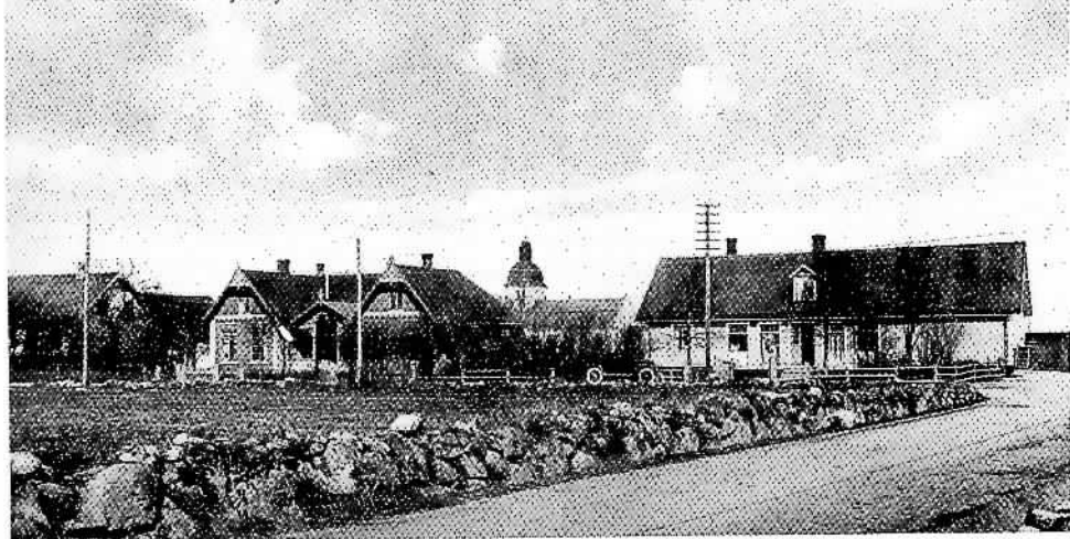
Parti från Mjällby.