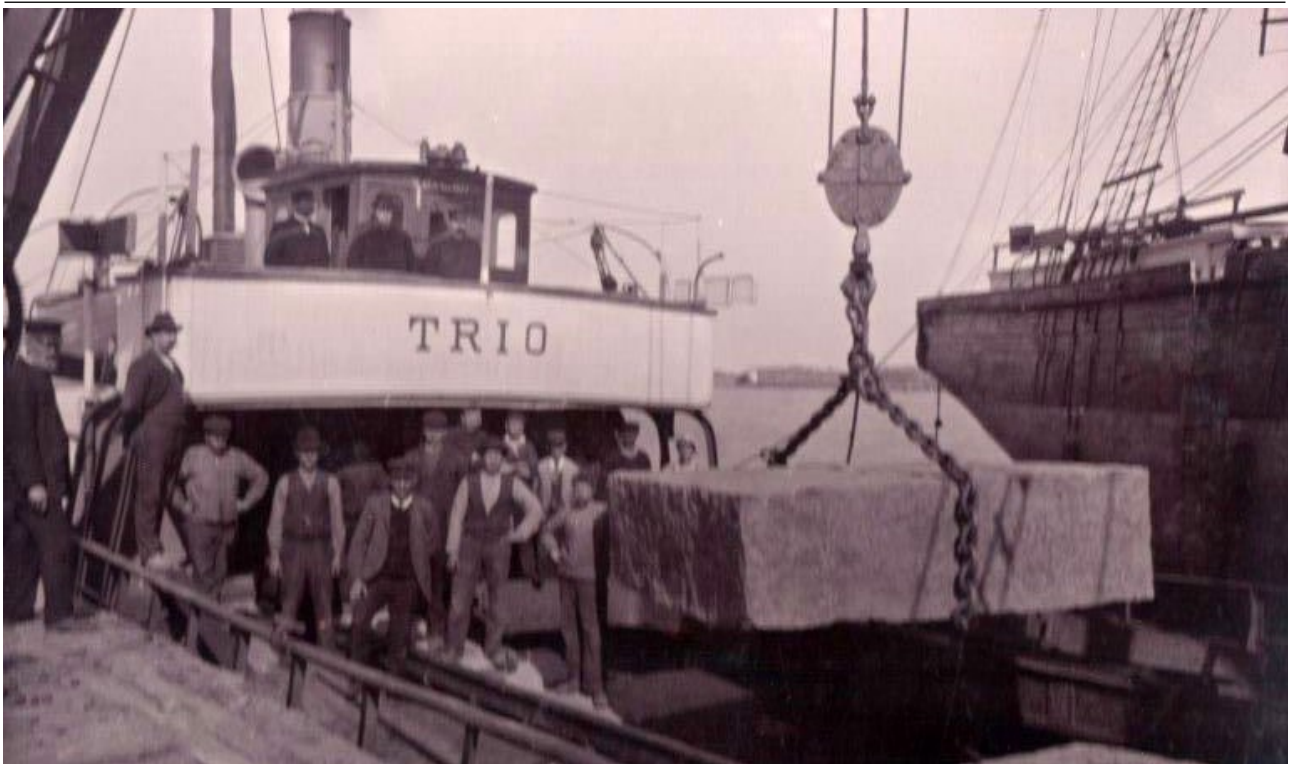
TRIO av Stockholm lastar stenblock i Sölvesborgs ytterhamn med handdriven lastkran i tidigt 1900-tal. Mellan Varvet och nuvarande Folkets hus fanns en stensliperifabrik ( läs mer om stensliperiet här ).