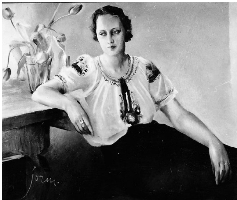
Dagmar Humbla; skådespelerska och operettprimadonna. Porträtt