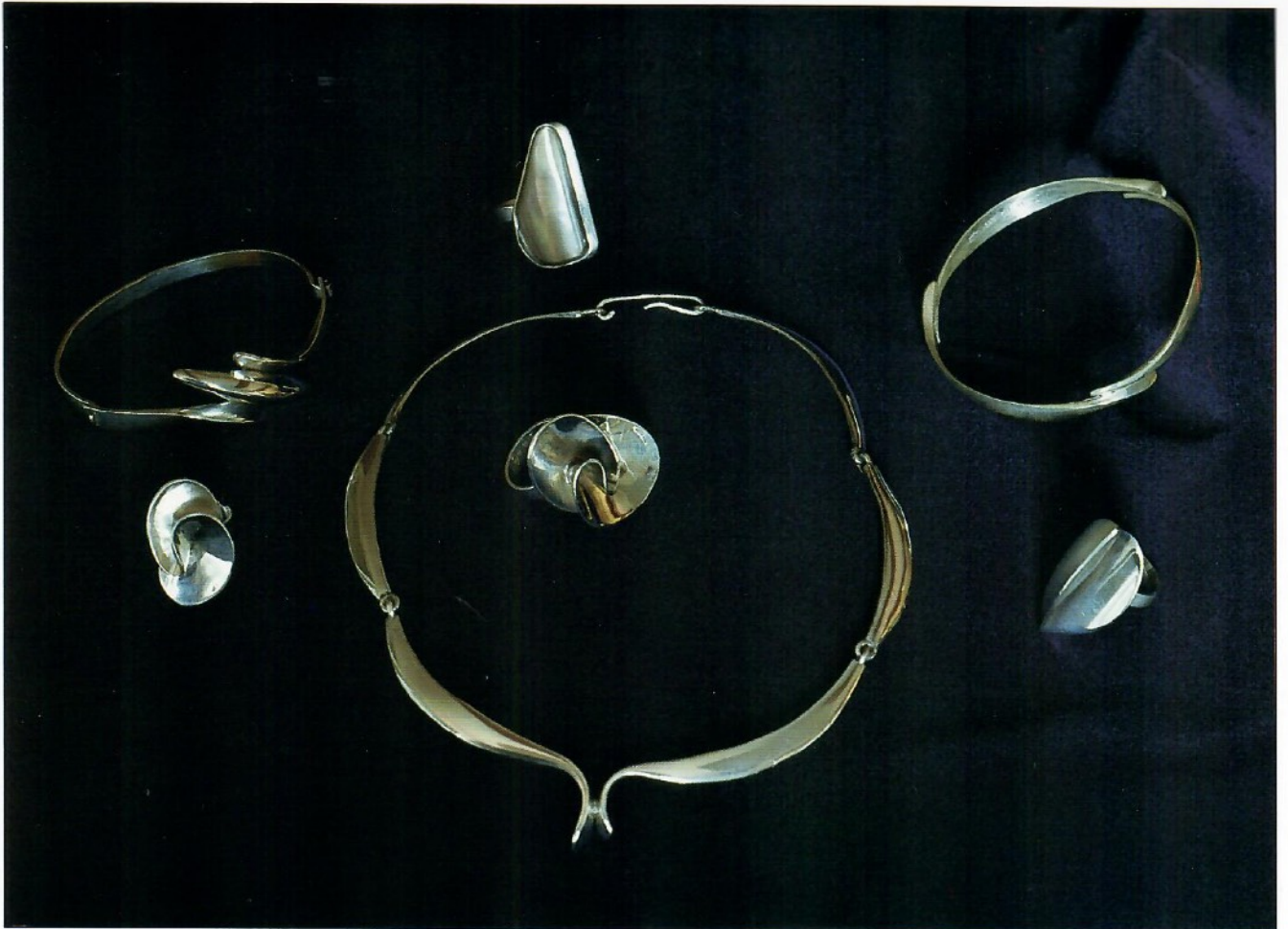
Silversmide i Hörvik / Local silver jewellery, Sölvesborg, Sweden