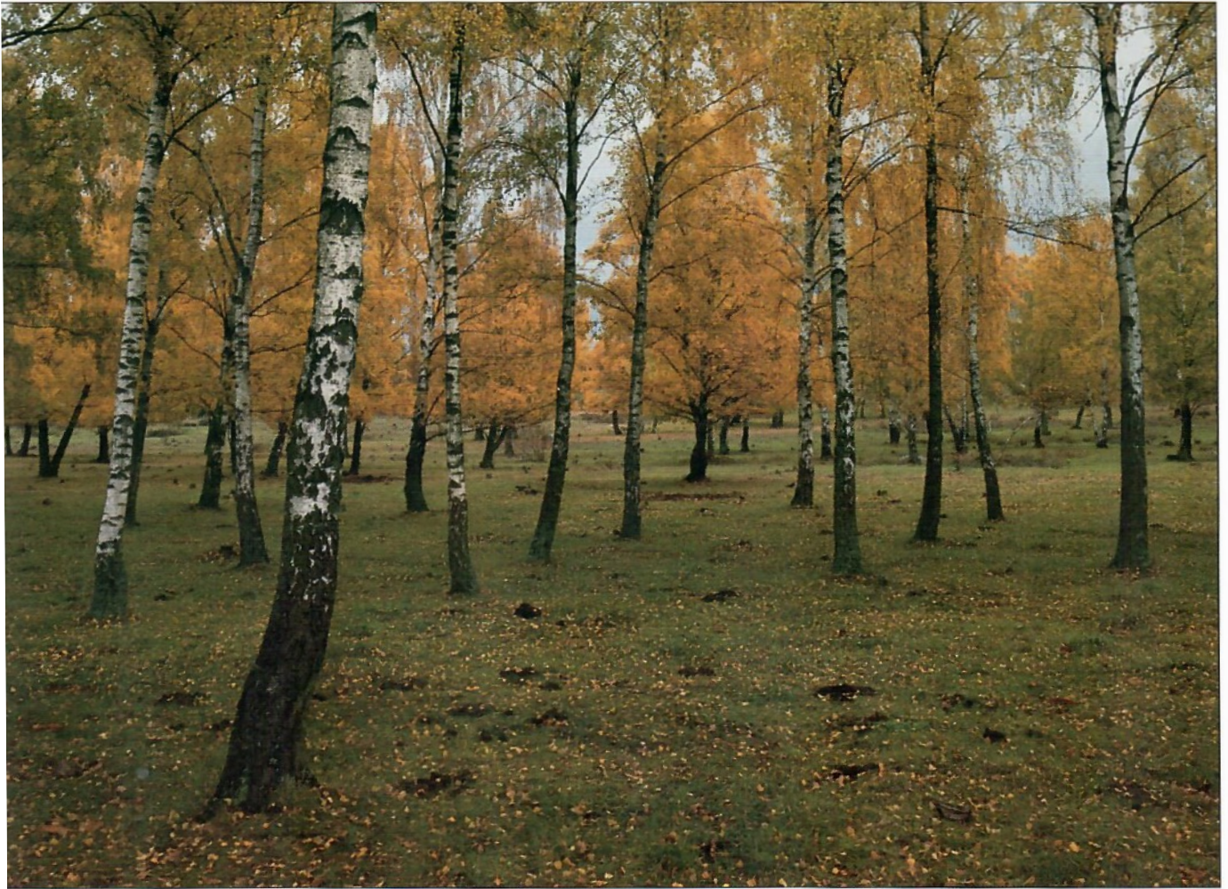
Stiby naturreservat / Stiby nature reserve, Sölvesborg, Sweden