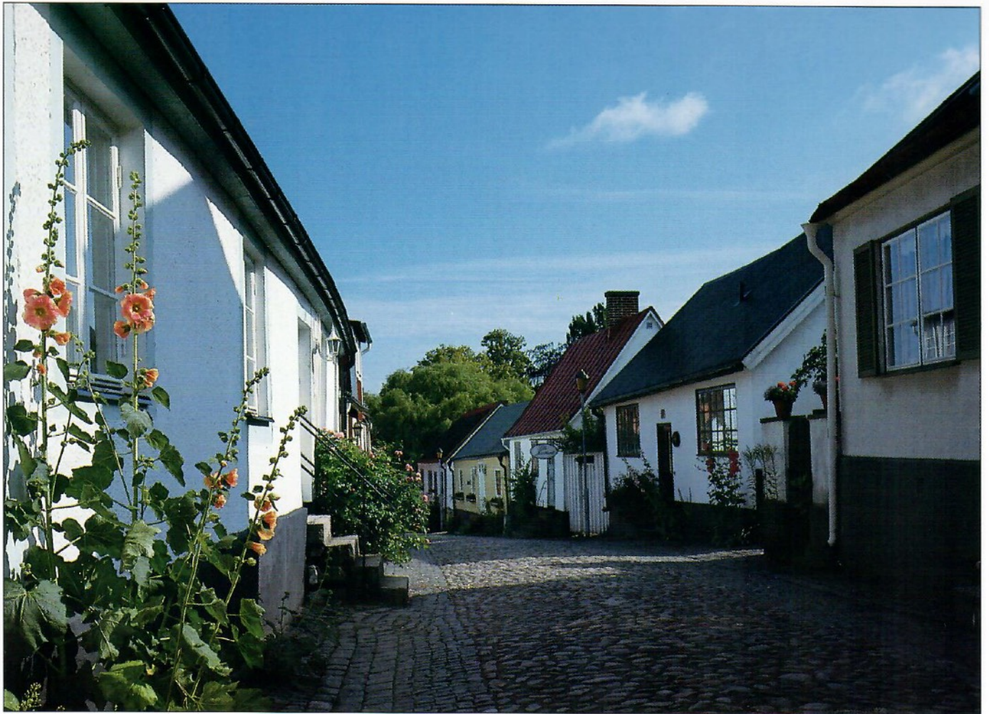
Norregatan / Norregatan, an old street, Sölvesborg, Sweden