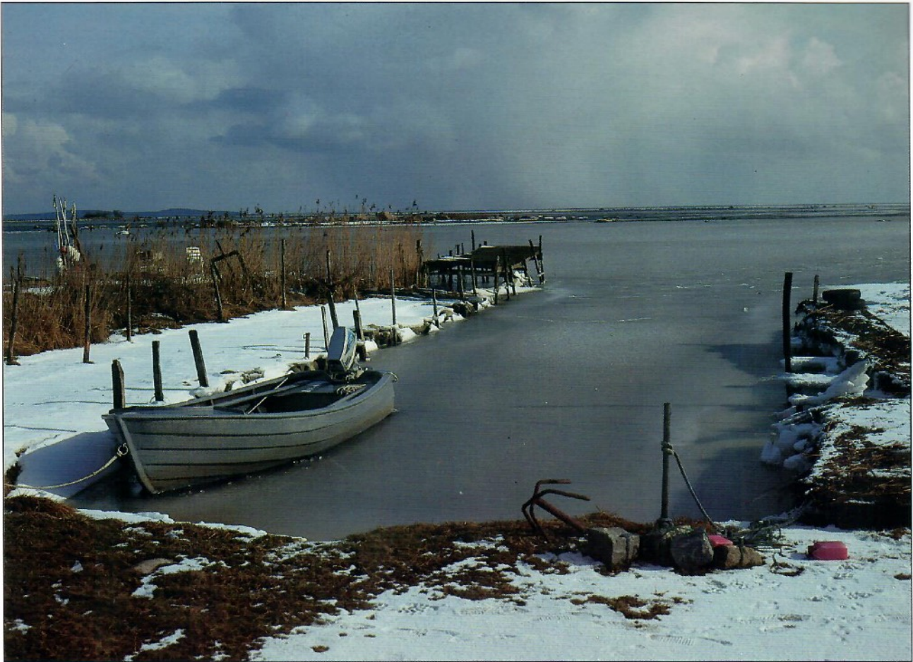
Kås vid Norjegryt / An old fishing harbour, Sölvesborg, Sweden