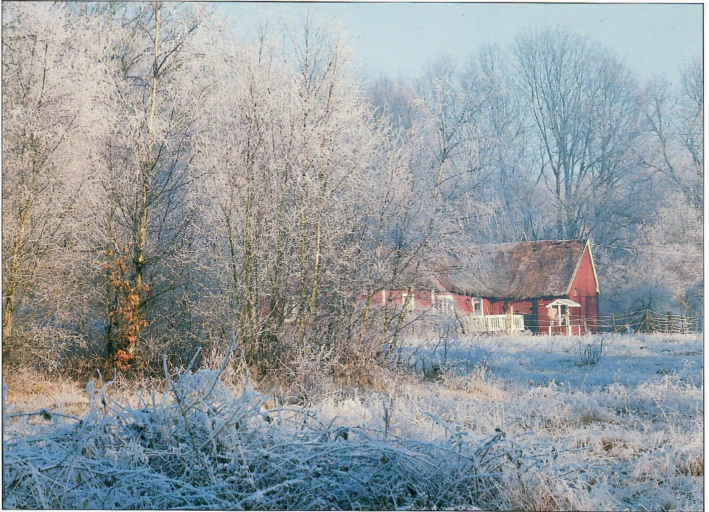
Jockarp, Sölvesborg, Sweden