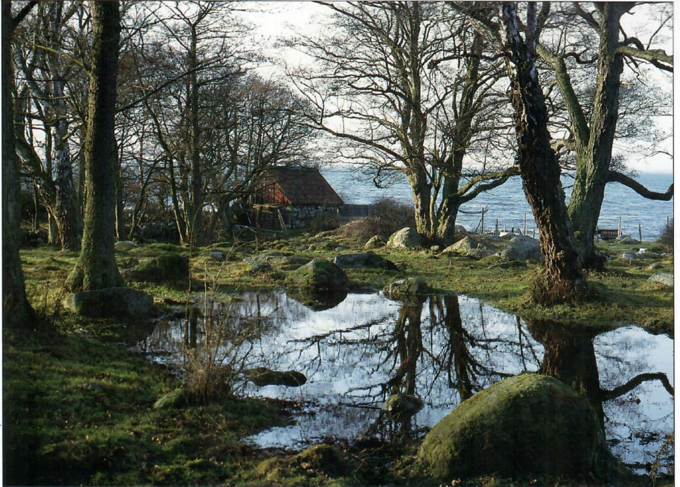
Grammahagen, Sölvesborg, Sweden