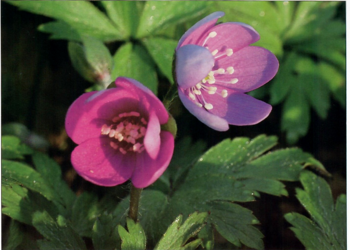
Vid Stiby backe / Stiby nature reserve, Sölvesborg, Sweden