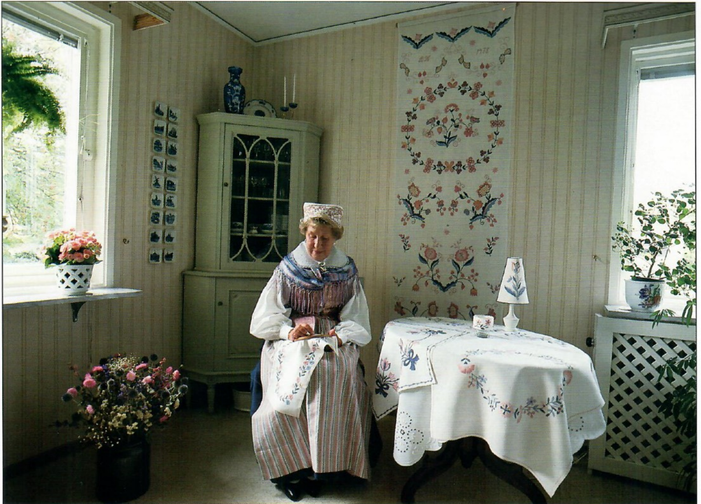
Blekingesöm / Blekinge County embroidery, Sölvesborg, Sweden