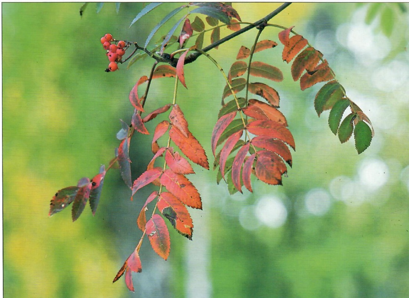
Rönblad / Rowan leaves, Sölvesborg, Sweden