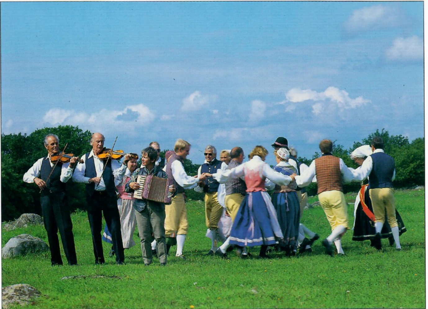
Slåtterdans / Hay making dance, Sölvesborg, Sweden