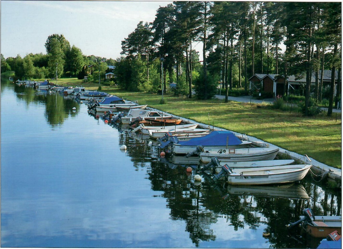
Norje kanal / The Norje Canal, Sölvesborg, Sweden