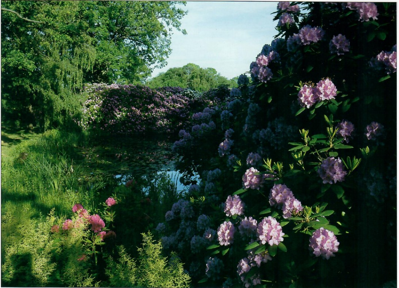
Slottskyrkogården / Rhododendrons , Sölvesborg, Sweden