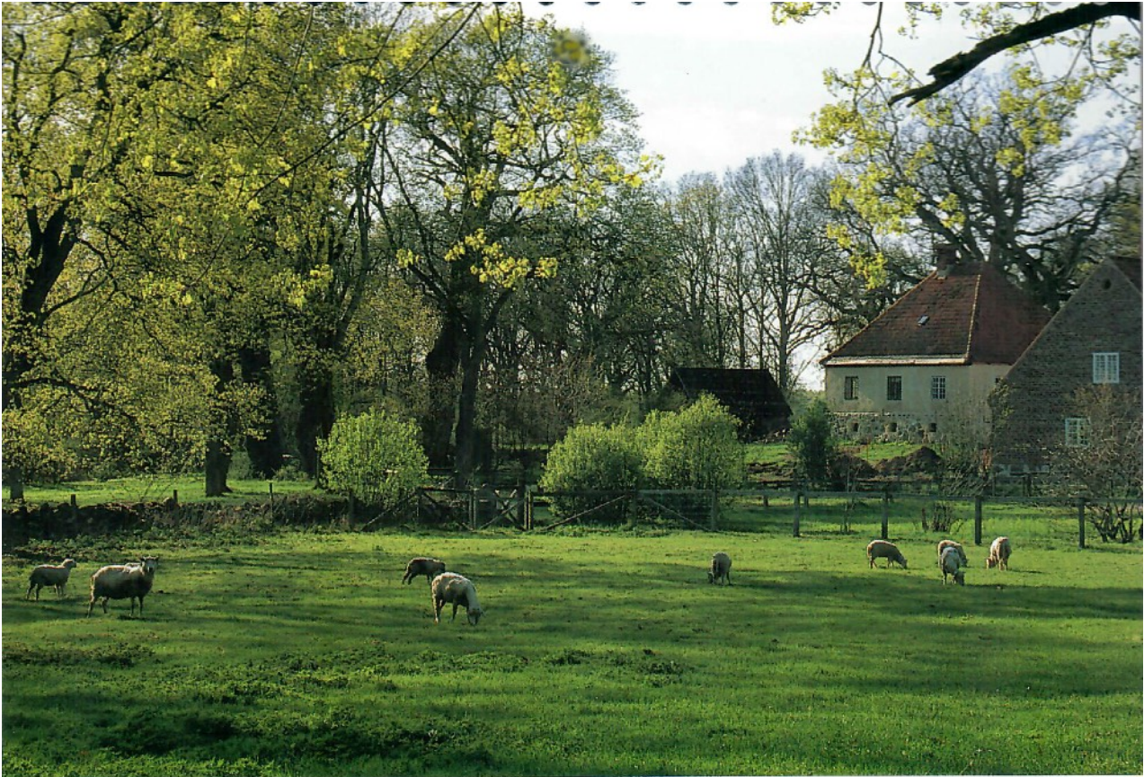
Pastoral idyll vid Valje gård