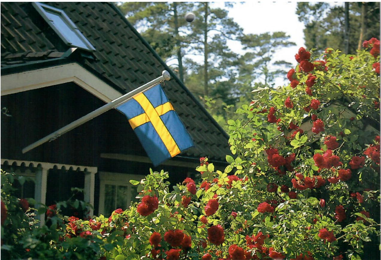
Sommar och rosor i Hällevik