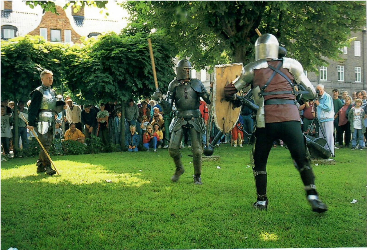
Medeltida marknad Killebom