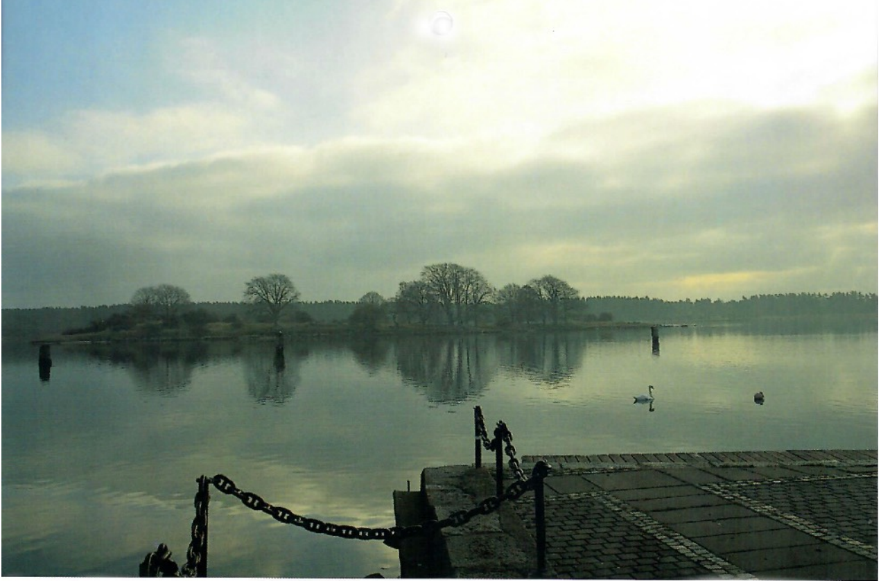
Sölvesborgsviken med Kaninholmen