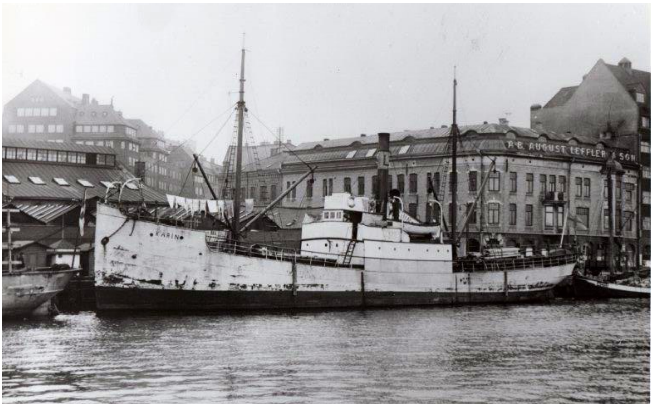
Ångaren Karin av Mjällby liggande vid Skeppsbron i Göteborgs hamn