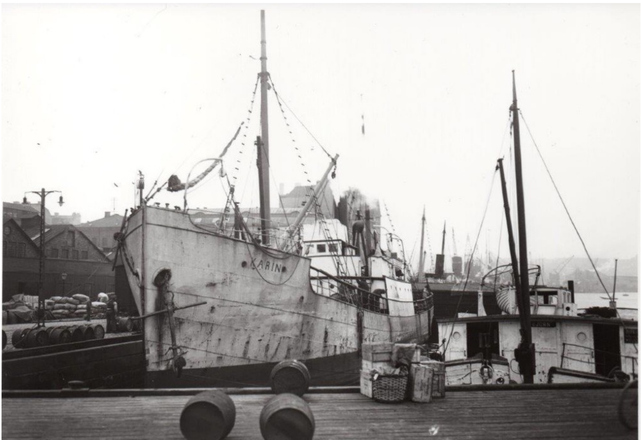
Karin av Mjällby liggande i Göteborgs hamn